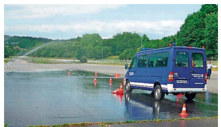
Training auf nassem Untergrund: THW-Fahrer übten auf präparierter Piste mit Hindernissen.

Alle Übungen mussten immer mit steigenden Geschwindigkeiten gefahren werden. Nach der Abschlussbesprechung gab es die Urkunden für das bestandene Fahrsicherheitstraining.